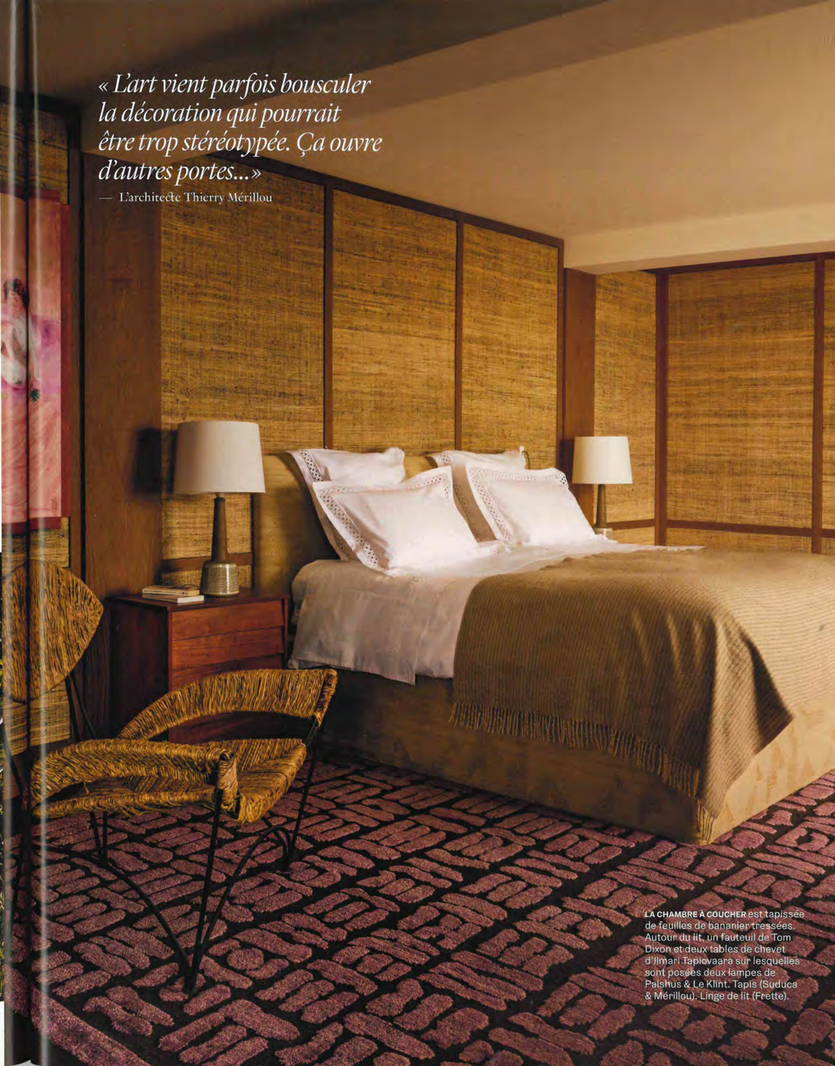
LA CHAMBRE À COUCHER est tapissée de feuilles de bananier tressées. Autour du lit, un fauteuil de Tom Dixon et deux tables de chevet d'Ilmari Tapiovaara sur lesquelles sont posées deux lampes de Palshus & Le Klint. Tapis (Suduca & Méryllou). Linge de lit (Frette).