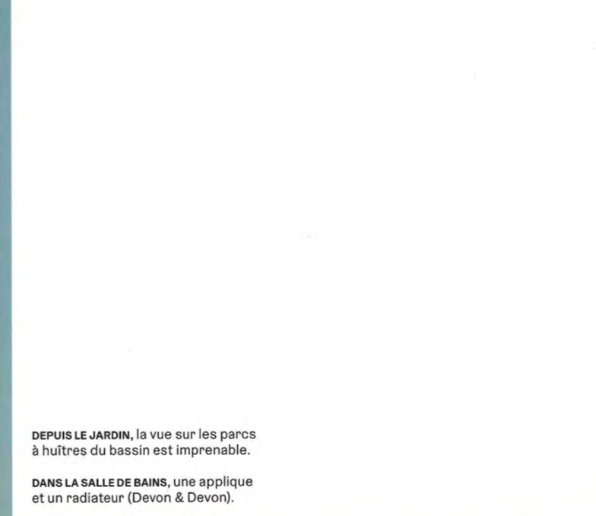
DEPUIS LE JARDIN, la vue sur les parcs à huîtres du bassin est imprenable.