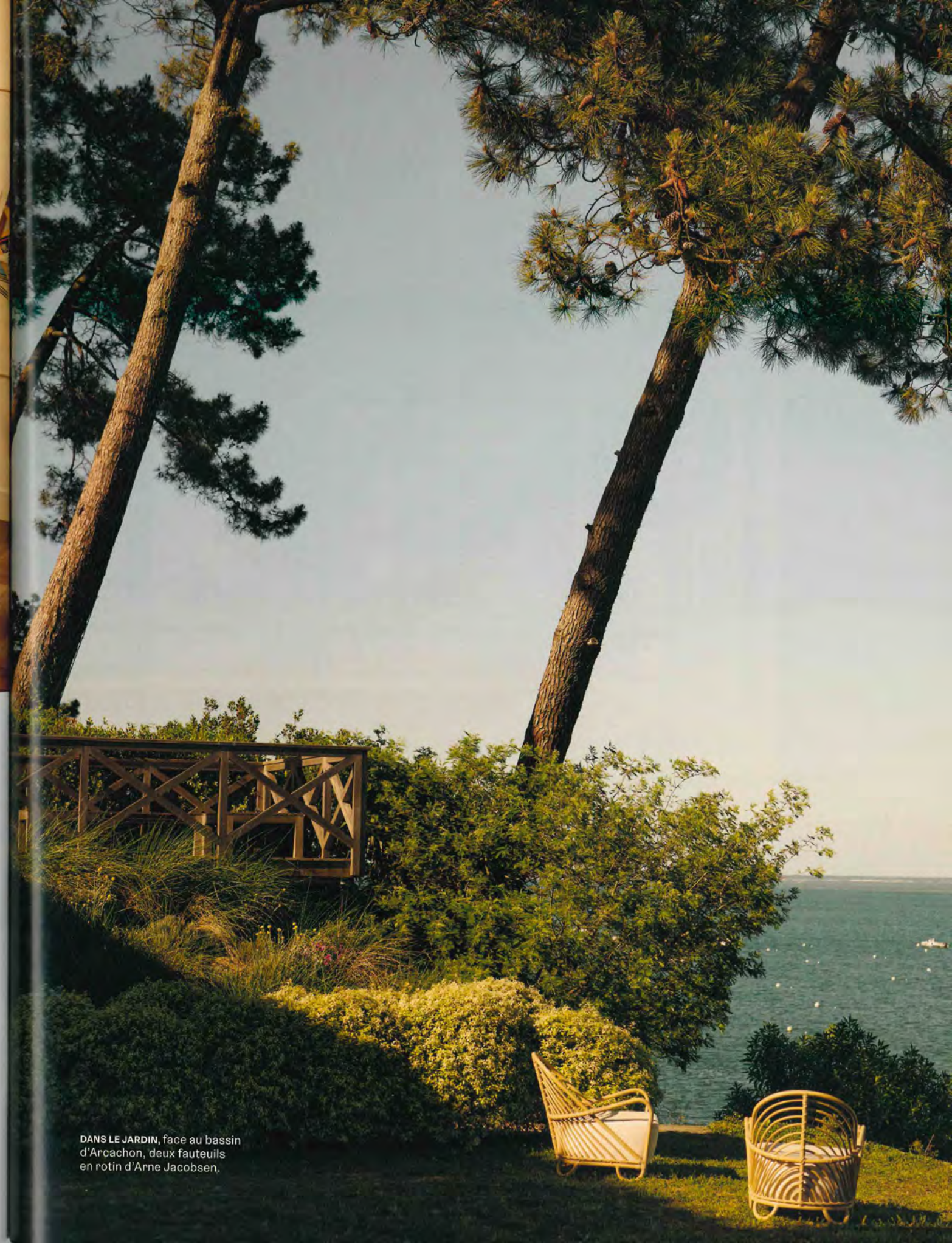
DANS LE JARDIN, face au bassin d'Arcachon, deux fauteuils en rotin d'Arne Jacobsen.