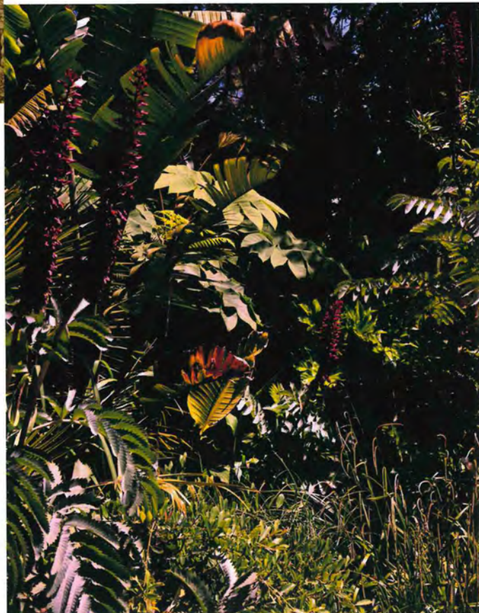
LE JARDIN, luxuriant, a été aménagé par Louis Benech.

« L'art vient parfois bousculer la décoration qui pourrait être trop stéréotypée. Ça ouvre d'autres portes... »