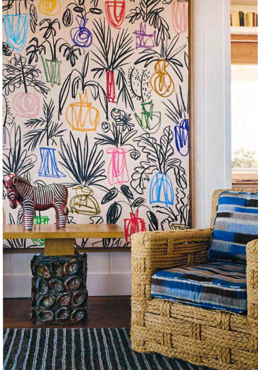
DANS LE SALON, devant une grande toile de B.D. Graft, sur un guéridon de Bela Silva, un cheval Primavera. À droite, un fauteuil d'Audoux-Minet.