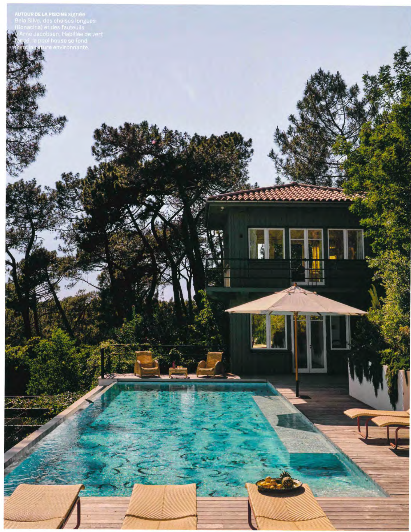
AUTOUR DE LA PISCINE signée Bela Silva, des chaises longues (Bonacina) et des fauteuils d'Arne Jacobsen. Habillée de vert foncé, la pool house se fond dans la nature environnante.